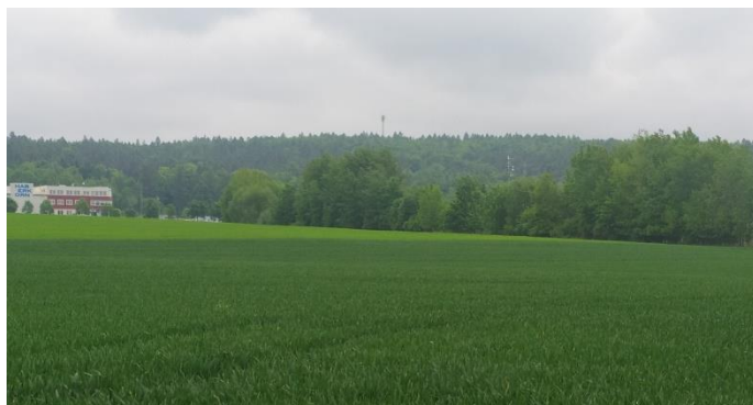
Obrázek č. 6: Biokoridor Na Nivě, Mokré Lazce

zamezilo se splachu ornice na silnici. Vzniklo zde vhodné prostředí pro obojživelníky i drobnou zvěř. Obec vlastní cca 30 ha obecních lesů, v současné době čistí les samovýrobci vlastními prořezávkami.