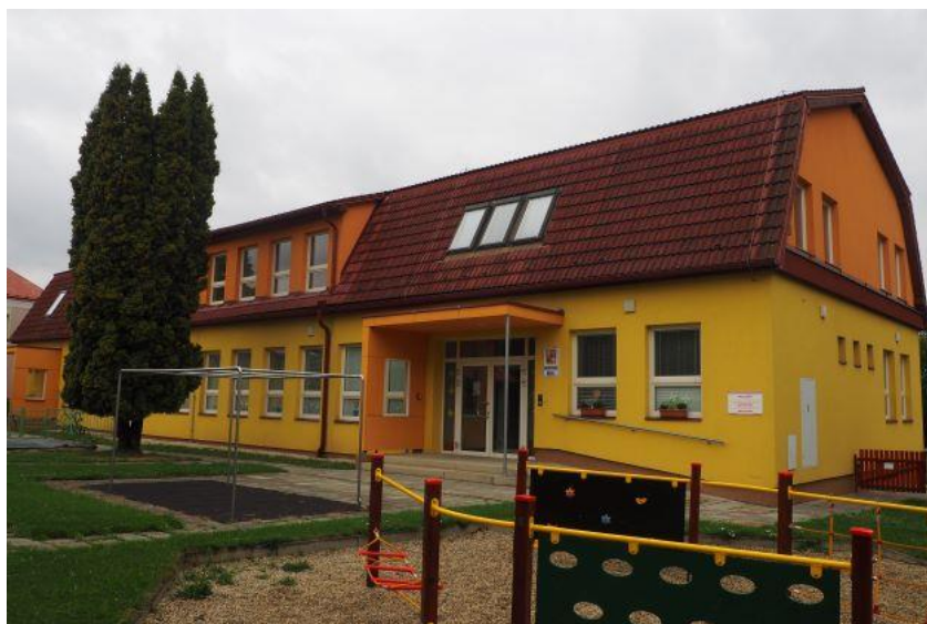
Obrázek č. 2: Mateřská škola Mokrý Lazce

Zdroj: Data odboru školství SO ORP Opava