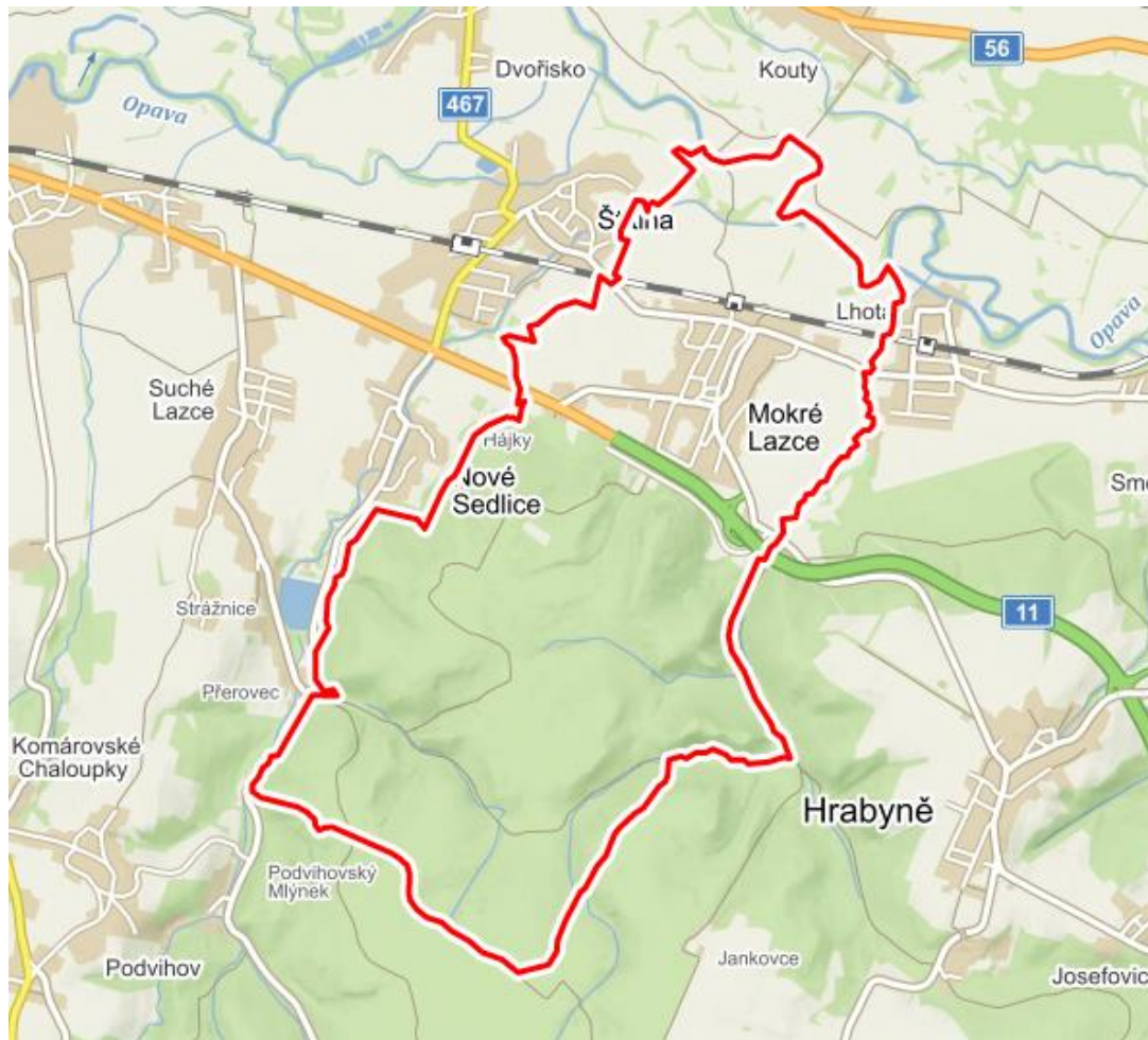
Obrázek č. 1: Mapa obce Mokré Lazce