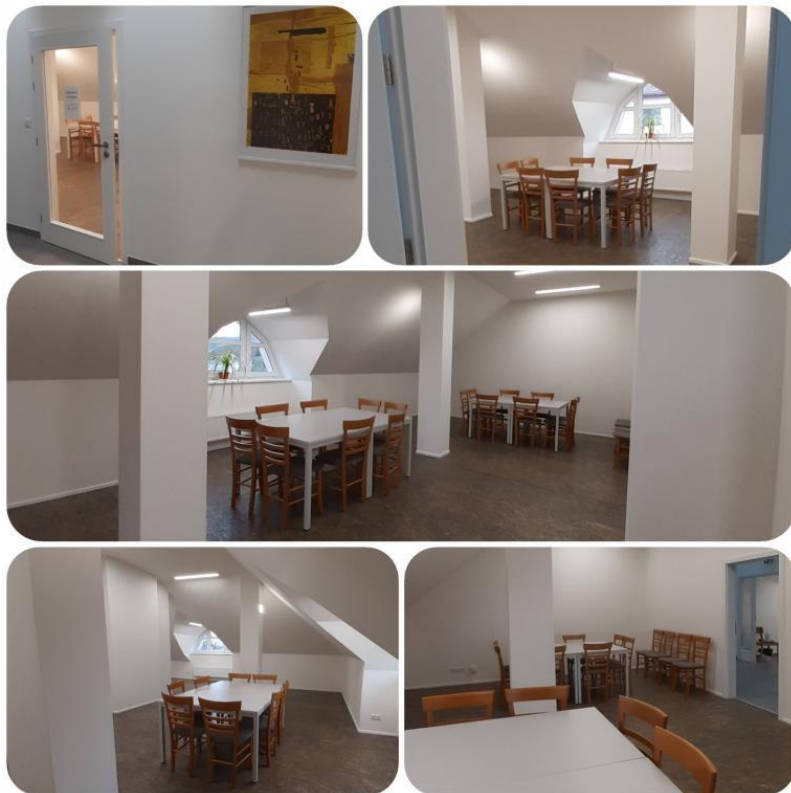
Obrázek č. 4: Komunitní centrum Mokré Lazce

Knihovna obce je umístěna v Komunitním centru obce v podkroví budovy prodejny potravin. Knihovna je otevřena dvakrát týdně. Knihovna poskytuje čtenářům jak knihy z vlastního fondu, tak z fondu regionálního. Výměnné soubory jsou do knihovny dodávány několikrát do roka, metodiky z knihovny Petra Bezruče v Opavě. Knižní fond si lze prohlédnout prostřednictvím webového katalogu. Knihovna nabízí čtenářům výpůjčky knih a časopisů, veřejně přístupný internet, meziknihovní výpůjční služby a rezervaci knih.