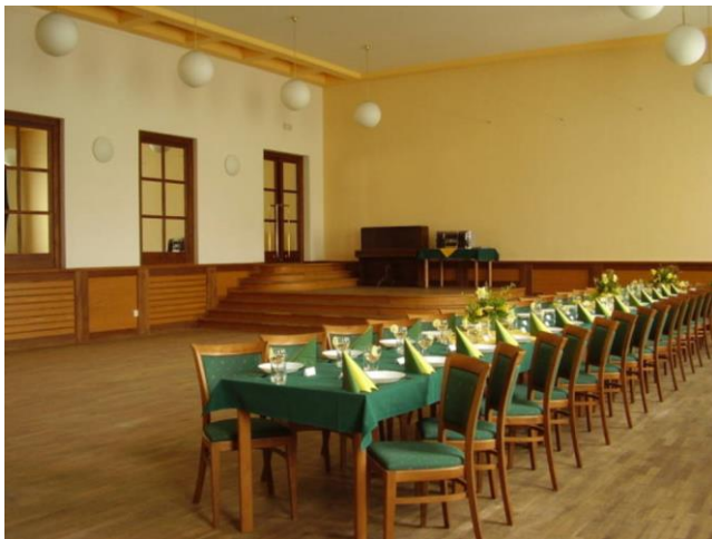
Obrázek č. 5: Kulturní sál obce Mokré Lazce