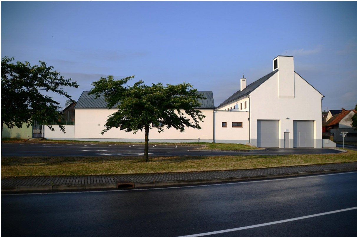
Obrázek č. 7: Hasičská zbrojnice Mokrý Lazce

V roce 2020 byla vybudována nová hasičská zbrojnice, zároveň byl jednotce pořízen nový dopravní automobil. Hasičská zbrojnice slouží jak zásahové jednotce JPO III, tak také SDH obce ke klubové činnosti. Zároveň byla jednotce pořízena specializovaná technika, oba projekty byly financovány z fondů Evropské unie.