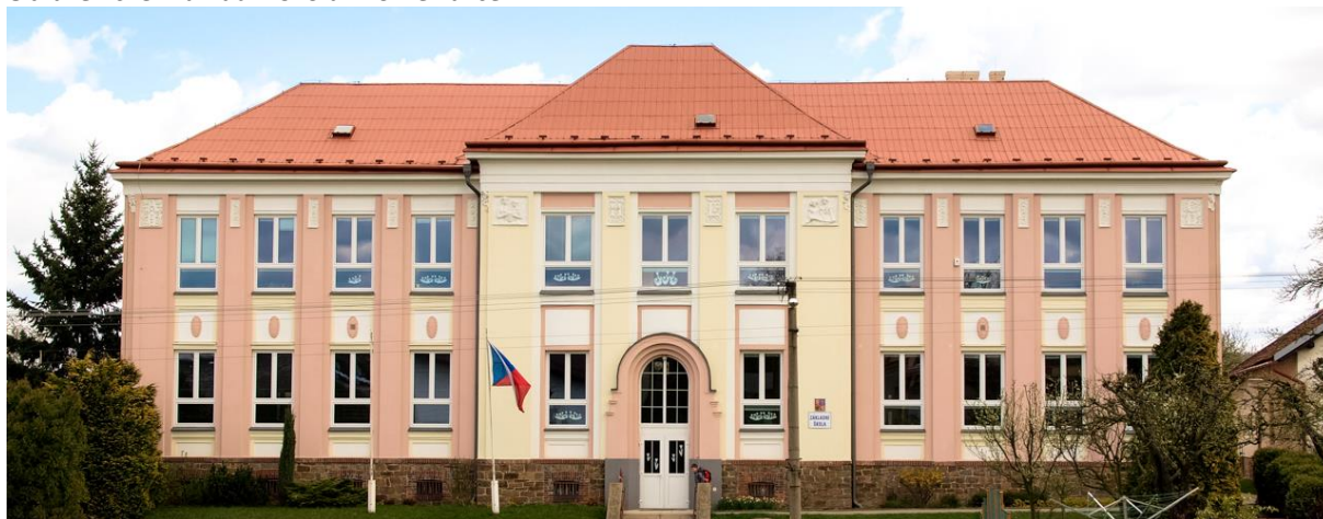
Obrázek č. 3: Základní škola Mokré Lazce